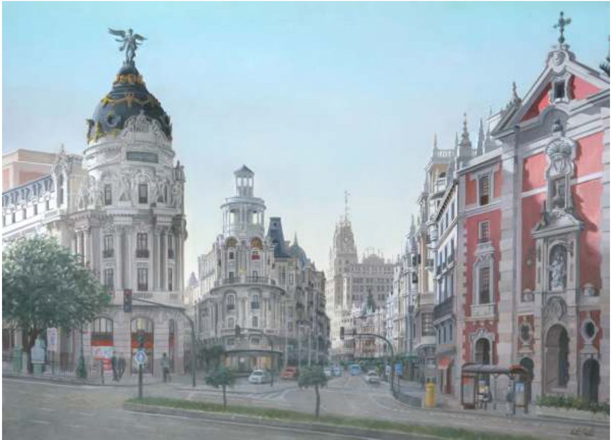
Madrid desde el Circulo de Bellas Artes óleo sobre lienzo | 81 x 65 | año 2014