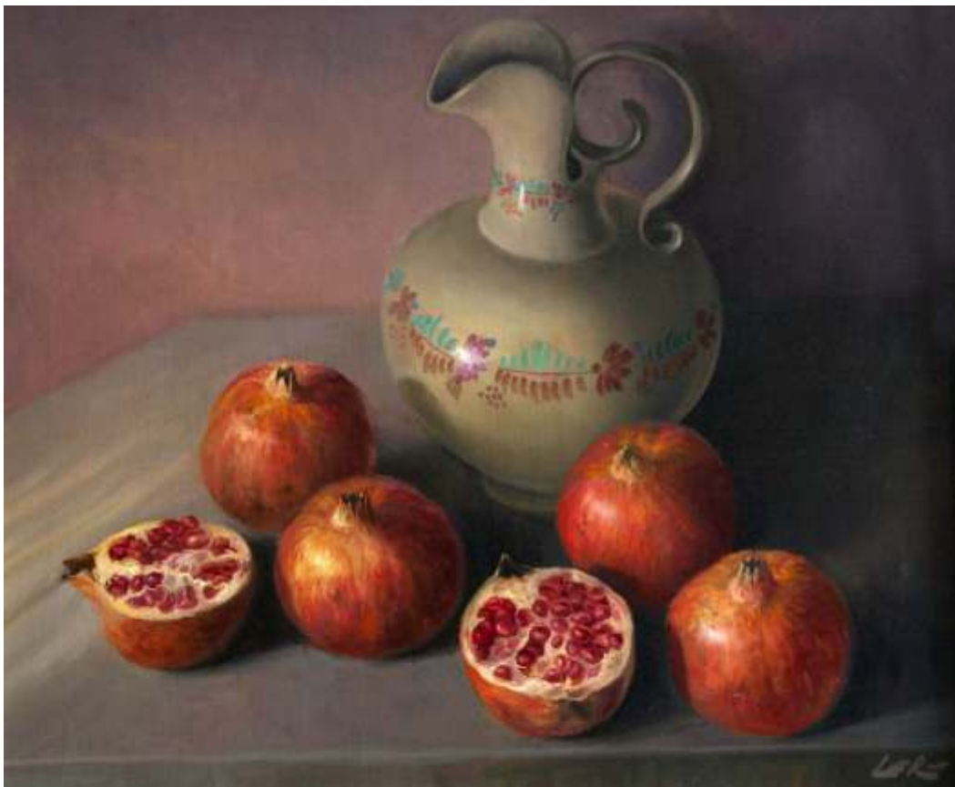
Bodegón con granadas óleo sobre lienzo | 55 x 46 | año 2012