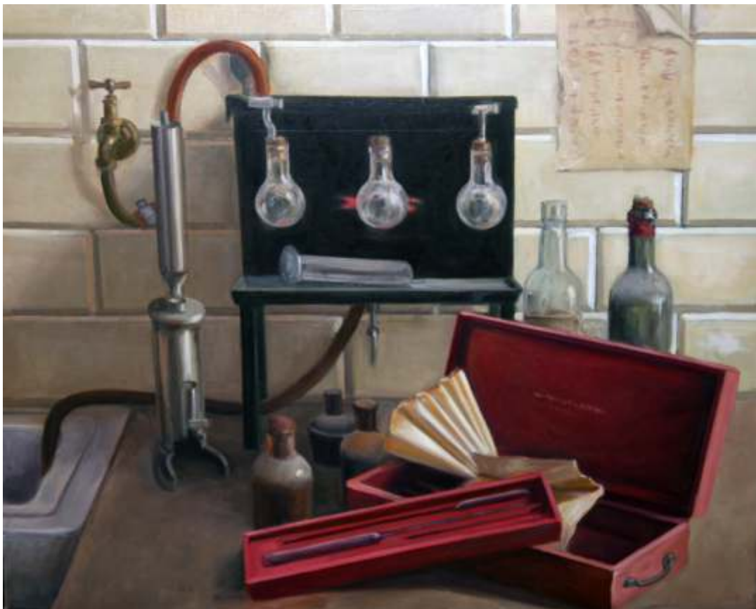
Laboratorio óleo sobre lienzo | 65 x 54 | año 2016