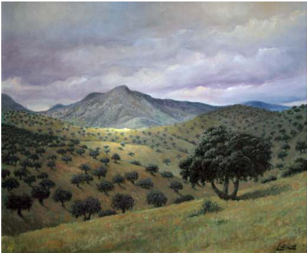
Sierra Madrona óleo sobre lienzo | 60 x 73 | año 2003